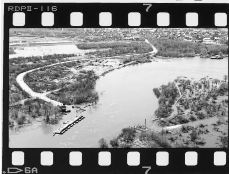
Клязьма. Разлив с высоты птичьего полета.